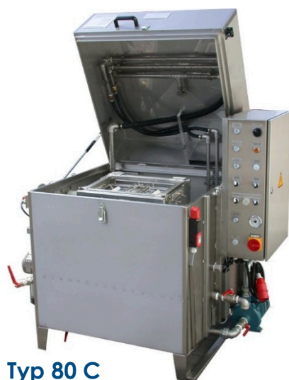
Typ 80 C

Automaty oczyszczające C są urządzeniami kombinowanymi o następującym wyposażeniu podstawowym: