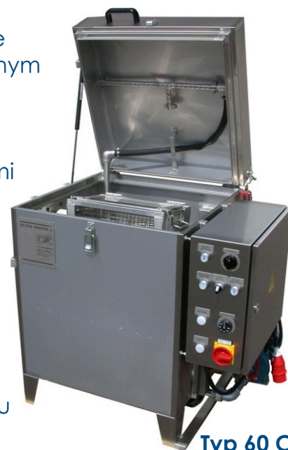
Typ 60 C

Wszystkie urządzenia mogą pracować zarówno w obszarze ciepło/woda (W) oraz w wykonaniu specjalnym - z oczyszczalnikiem na zimno/rozpuszczalnikiem (K).