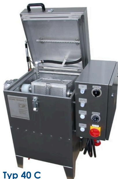
Typ 40 C

Typoszereg C powstał w wyniku rozbudowy urządzeń standardowych Typ W/K 40, W/K 60 oraz W/K 80.