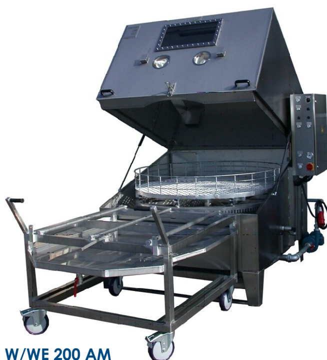
W/WE 200 AM

Dane techniczne poszczególnych modeli znajdują Państwo w naszym prospekcie „Program podstawowy“.