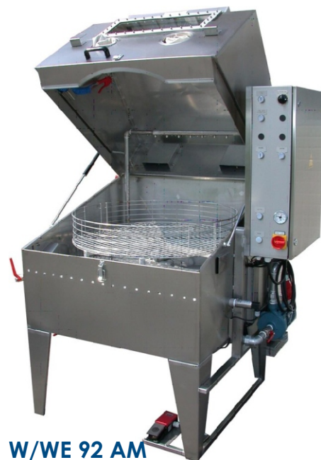
W/WE 92 AM

Chętnie przedstawimy Państwu szczegółową ofertę. Prosimy zwrócić się do nas!