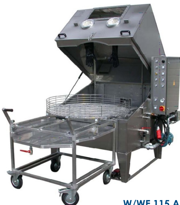
W/WE 115 AM

Od wielkości urządzenia 91/92 AM detale są oczyszczane bezpośrednio na koszu obrotowym.