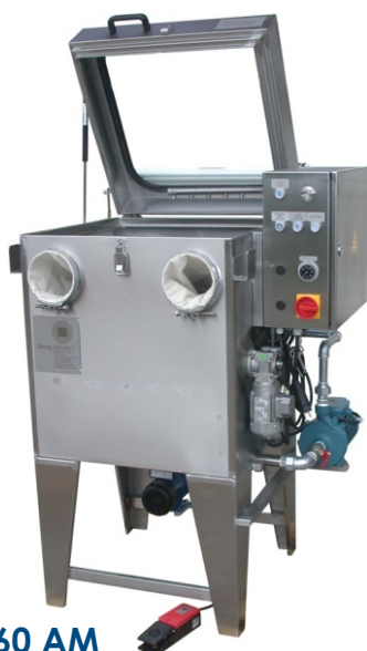
WE 60 AM

Urządzenie myjące Typoszeregu AM powstało w wyniku modyfikacji typoszeregu standardowego W. Modele od wielkości Typ 60 służą do oczyszczania automatycznego i ręcznego. Typoszereg AM został skonstruowany przede wszystkim do zastosowania w obszarze remontu i naprawy oraz do obróbki detali o szczególnie skomplikowanych kształtach.