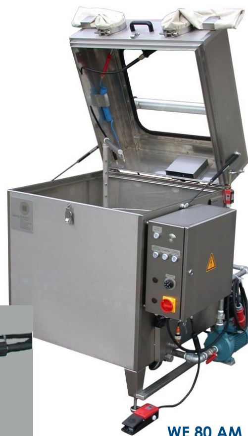
WE 80 AM